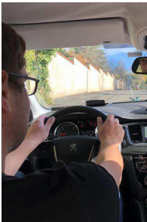
Les Informations sont saisies en temps réel dans le véhicule à caméra embarquée.

Cavalaire est la première cité du Sud-est à mettre en œuvre ce diagnostic relativement simple, rapide à réaliser et bien moins onéreux que les bureaux d'études travaillant à grande échelle dans les métropoles ou sur de grands réseaux. Aux administrés de juger si tout cela aura permis d'améliorer sensiblement la qualité de la voirie cavaloise, notamment sur ses axes secondaires moins « sensibles » touristiquement... E. C.